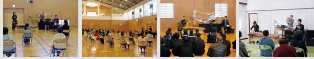
2/10 秩父第一小学校 5年生 2/10 秩父第一小学校 6年生 2/9 影森中学校 3年生 2/9 大滝公民館