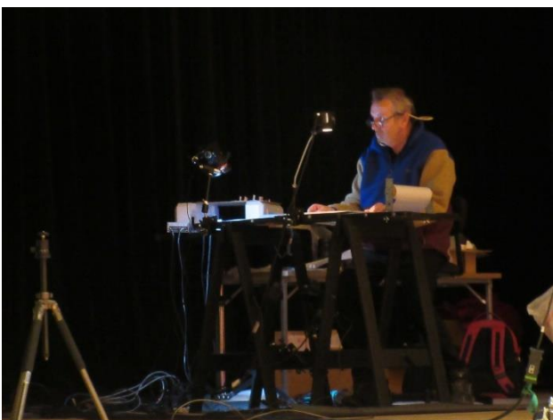
ダリオさんのまわりにはたくさんの機材が！！