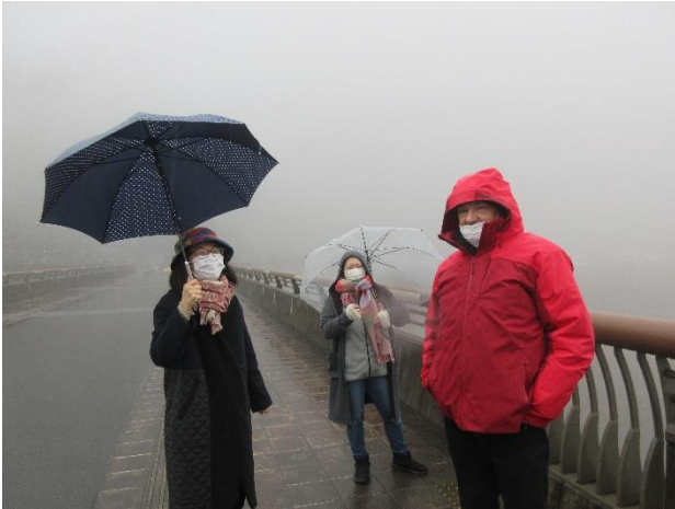
滝沢ダムでのお三方の様子！ 霧が深すぎて笑ってしまいました～。

おがの化石館やようばけでは、化石や地層を見ながら、太古の秩父に思いをはせました。