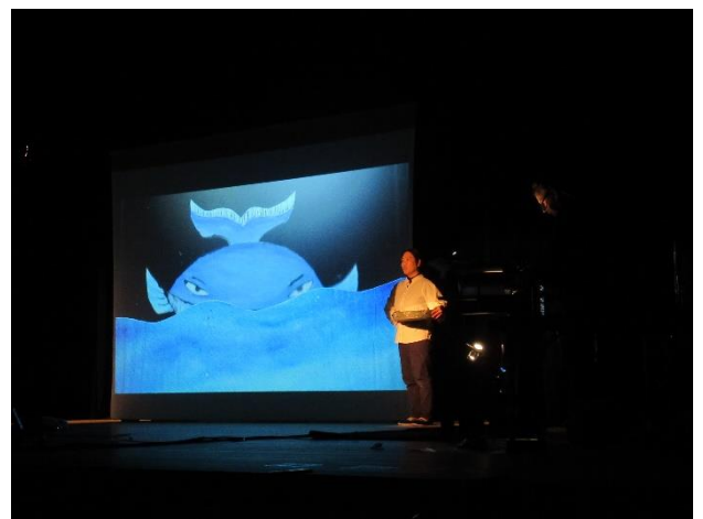
くじらも登場！！ いったいどんなシーンなのでしょう？？