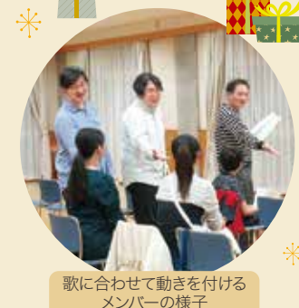
歌に合わせて動きを付けるメンバーの様子