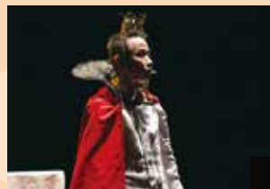
「はだかの王様」初演 (高知県立美術館2021)